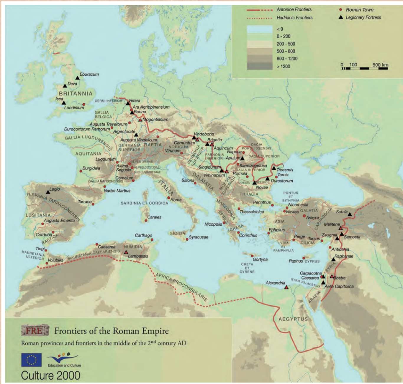
罗马帝国边疆防御体系分布图（公元二世纪中期）